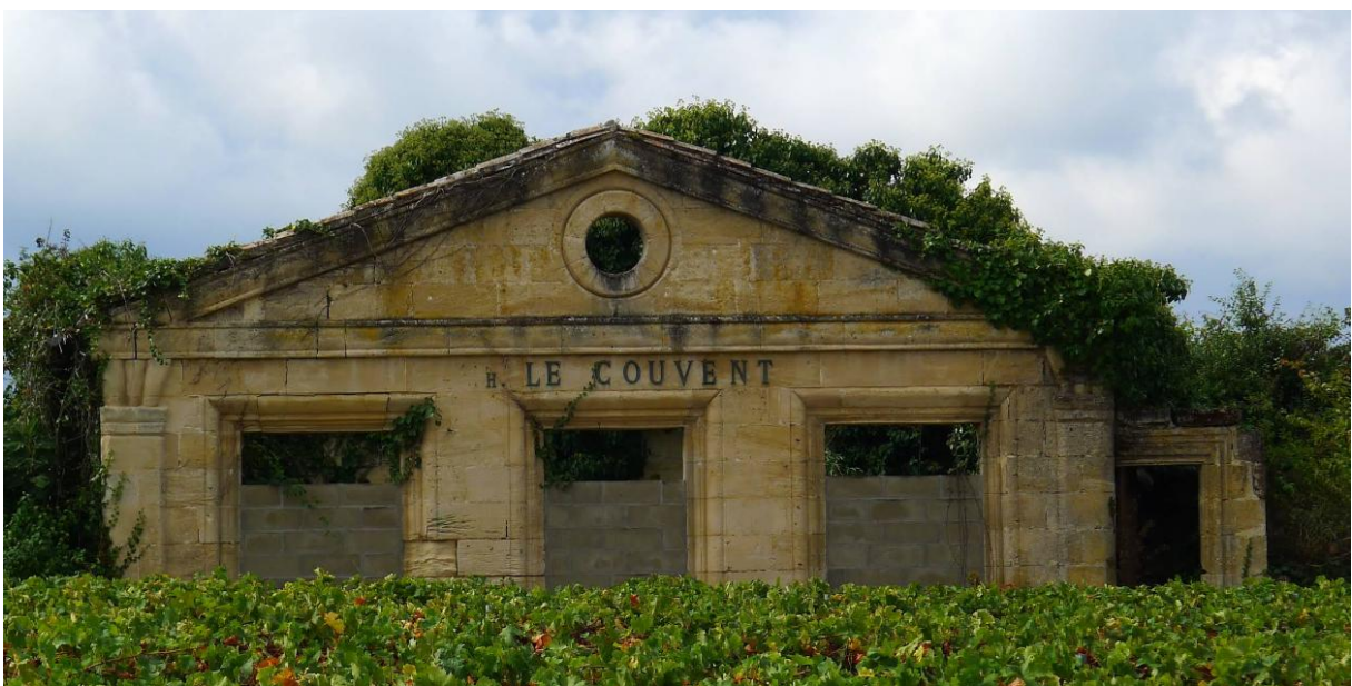
Couvent des Ursulines