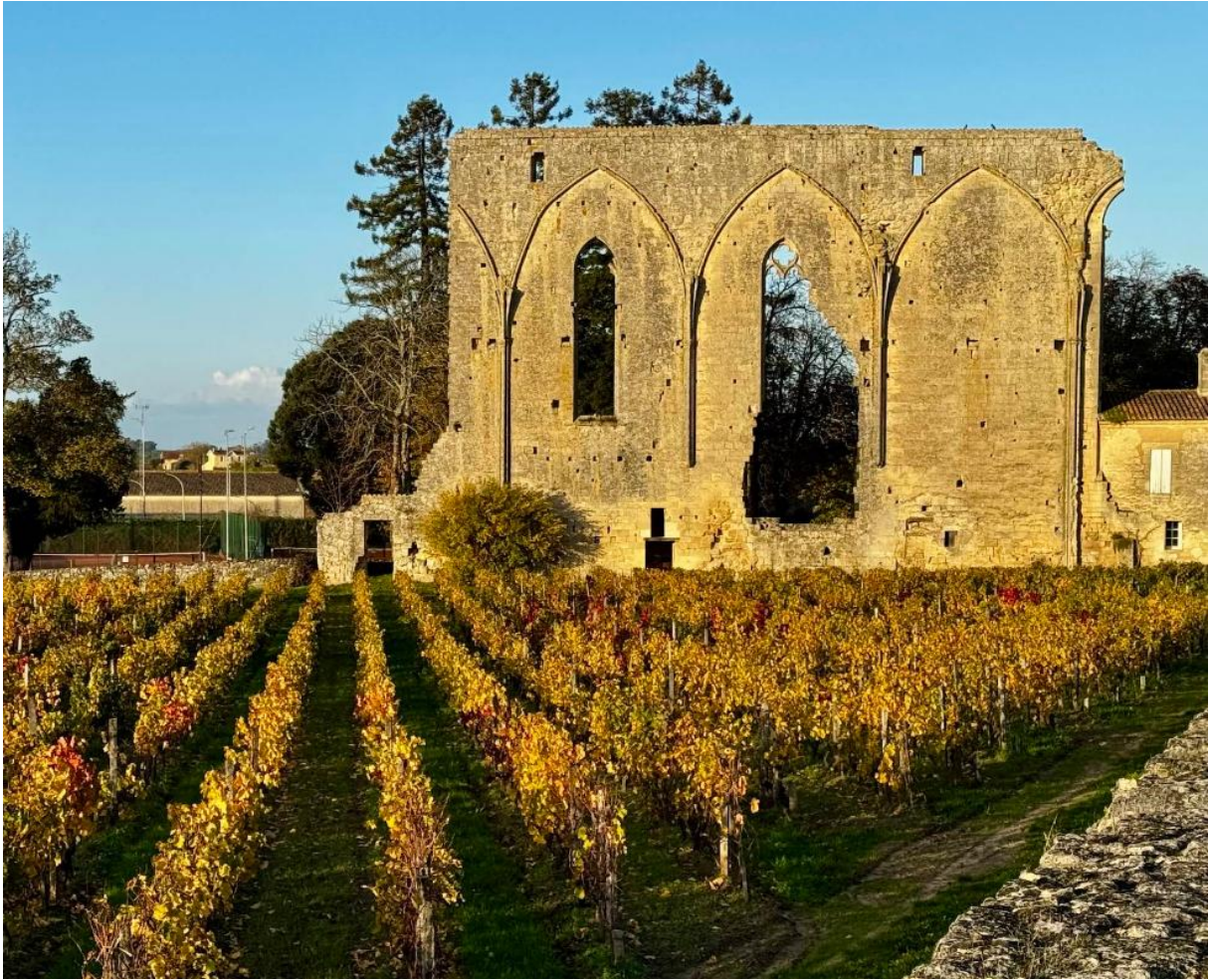
Les Grandes Murailles