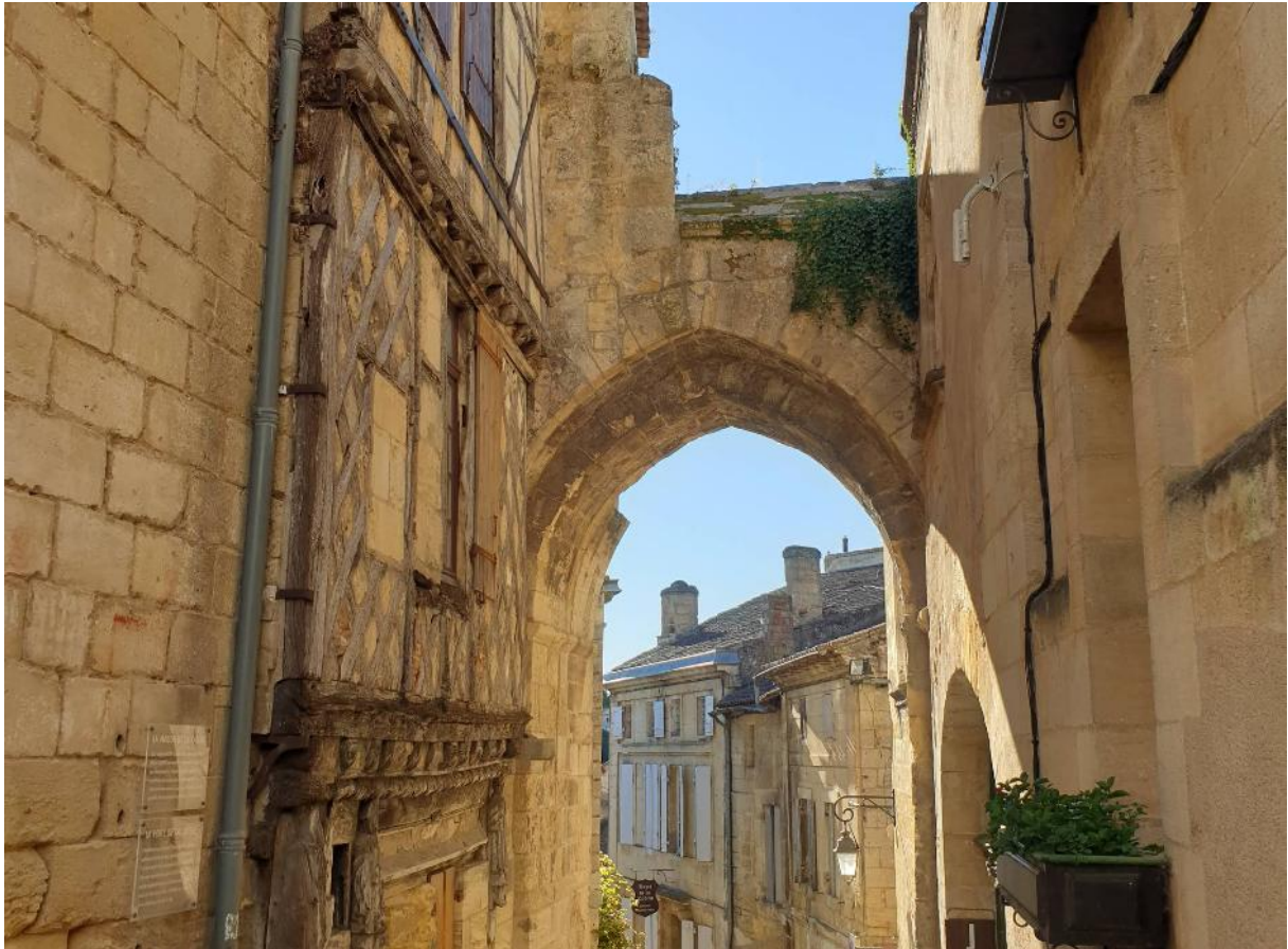
Porte de la Cadène