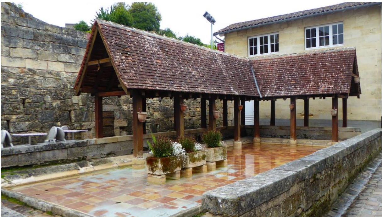
Fontaine du Roi