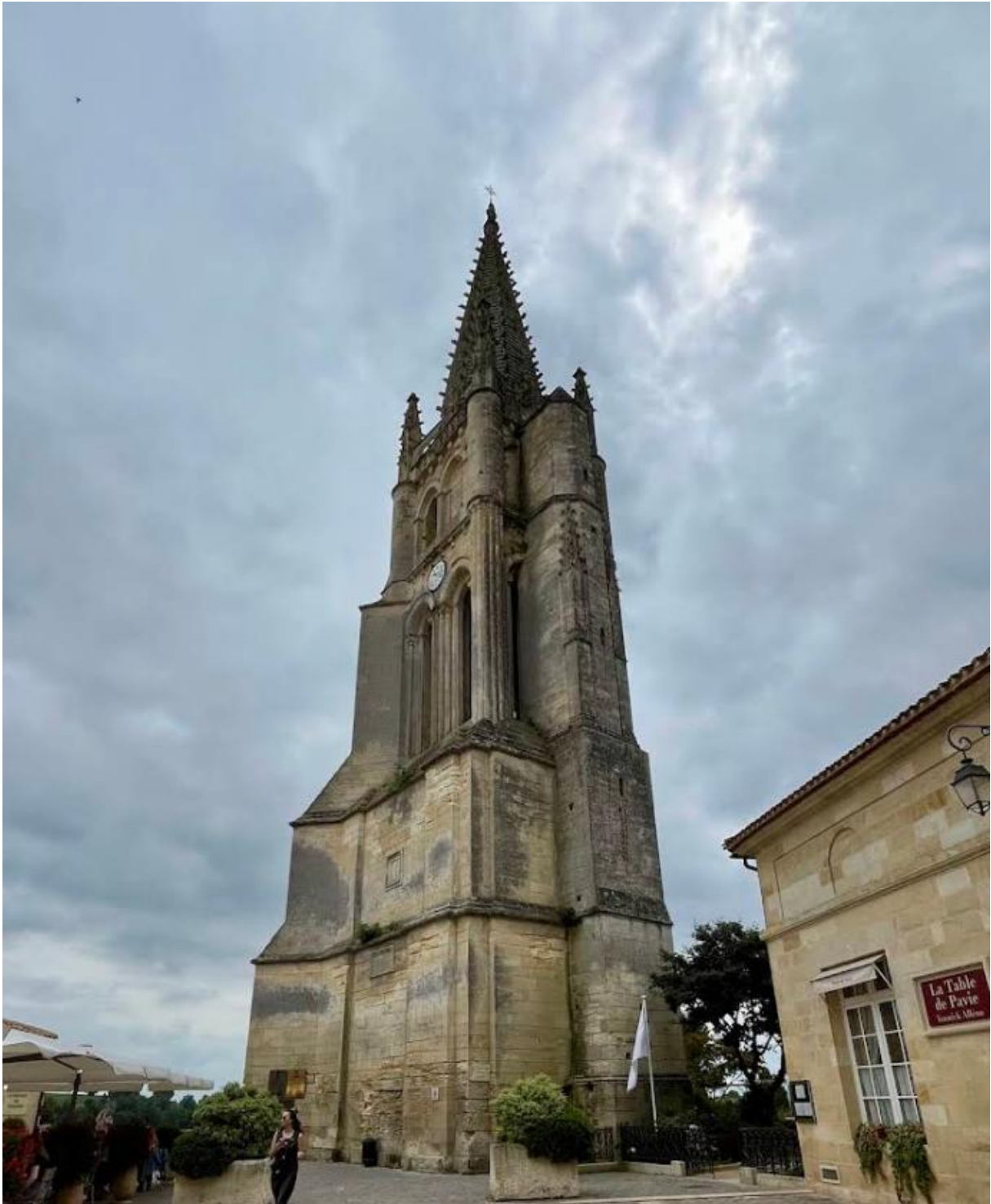
Église Catholique Collégiale