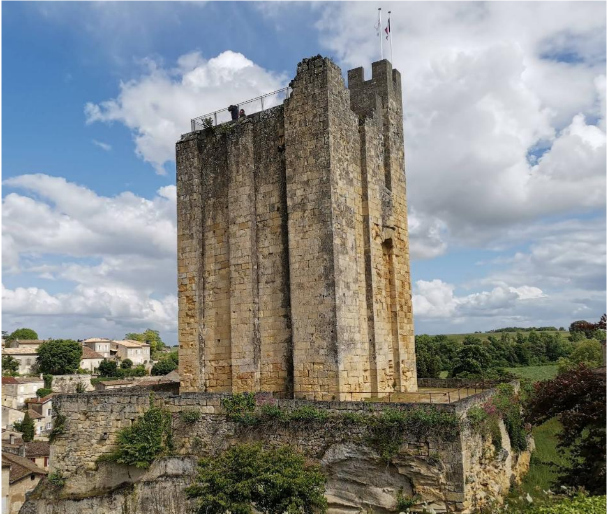
La Tour du Roy