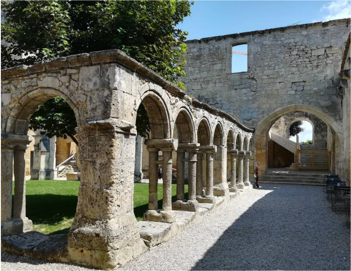
Cloître des Cordeliers